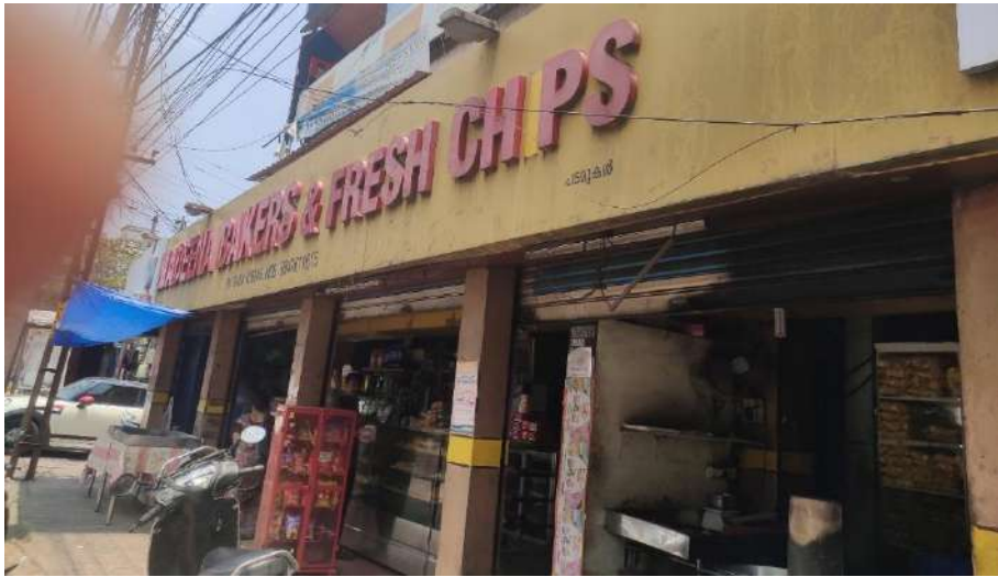
പടമുകൾ സ്റ്റേഷനുവേണ്ടി ഏറ്റെടുക്കപ്പെടുന്ന ഇരുനിലകെട്ടിടം