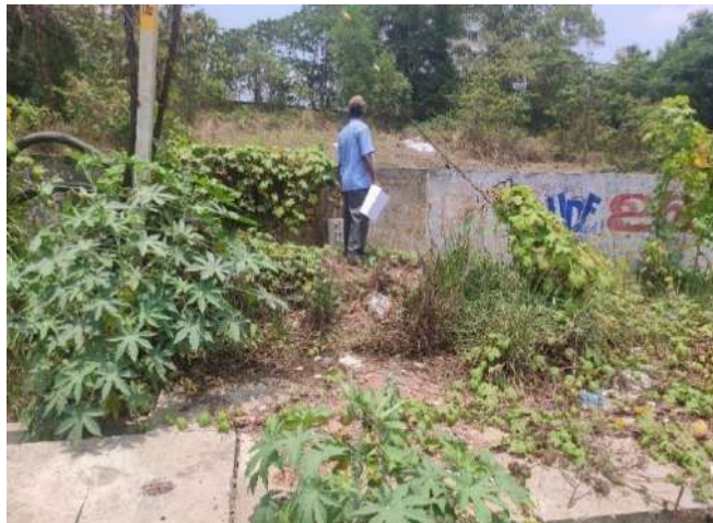
ചിറ്റേത്തുകര സ്റ്റേഷനുവേണ്ടി ഏറ്റെടുക്കപ്പെടുന്ന സർവ്വെ നമ്പർ 493/17