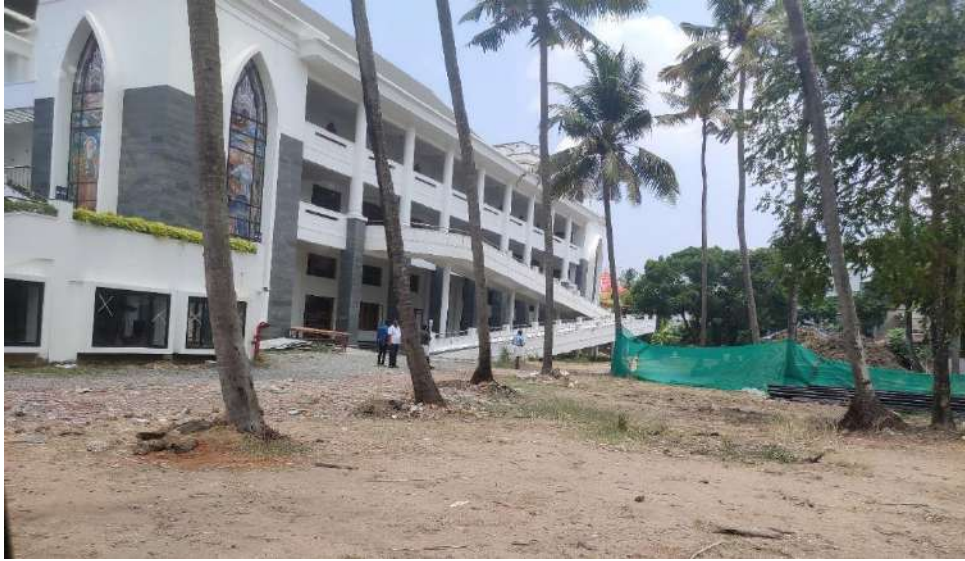
സെൻ്റർ.മൈക്കിൾസ് ദേവാലയത്തോട് ചേർന്നുകിടക്കുന്ന പദ്ധതി ബാധിത സ്ഥലം