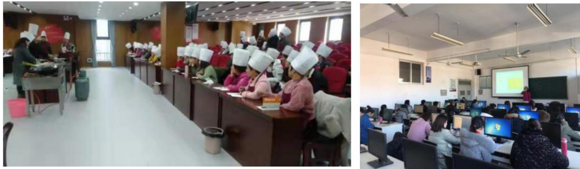
图 7-1 潮河办事处组织就业创业技能培训