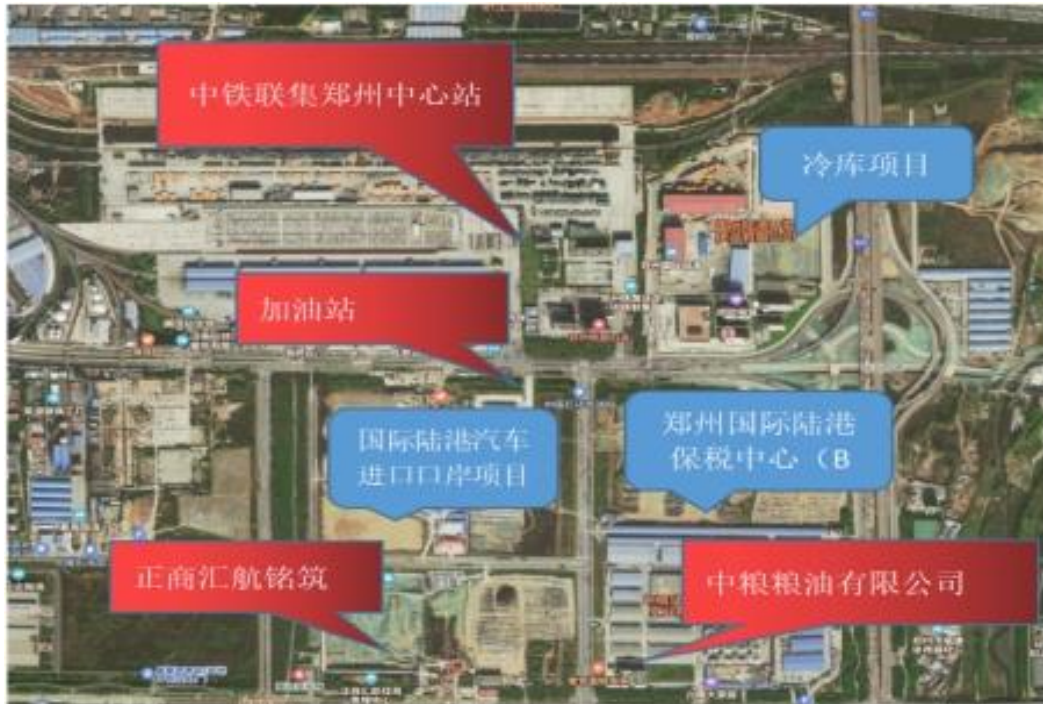
图 1-4 陆港建设项目毗邻单位分布图