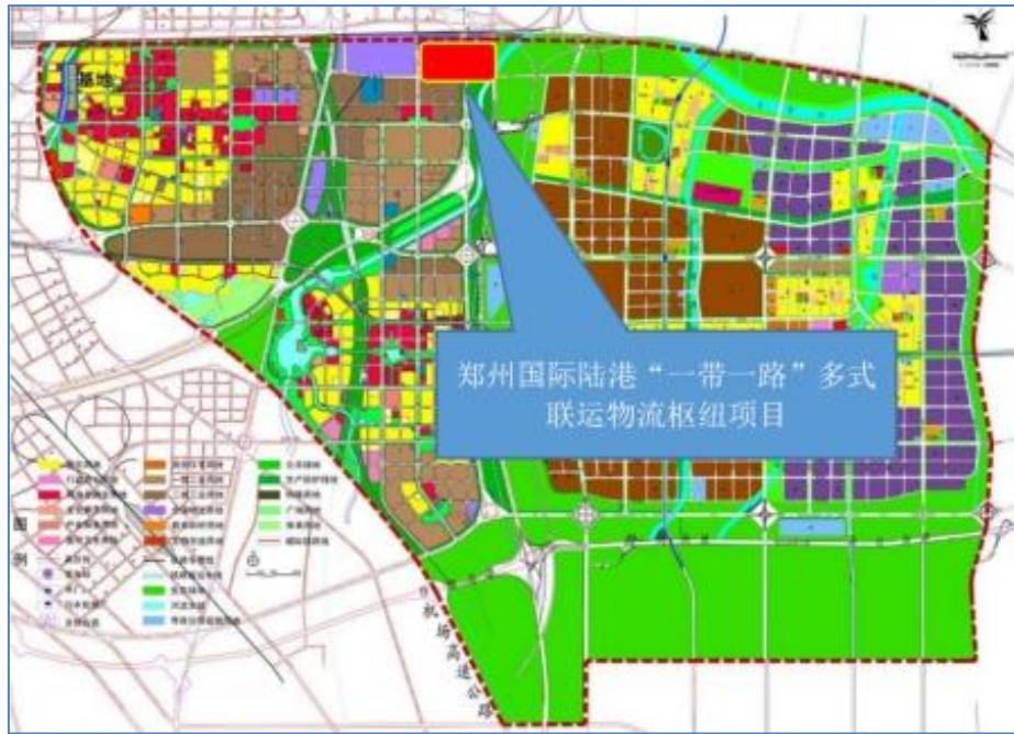
图 1-2 郑州国际陆港多式联运物流枢纽位置示意图