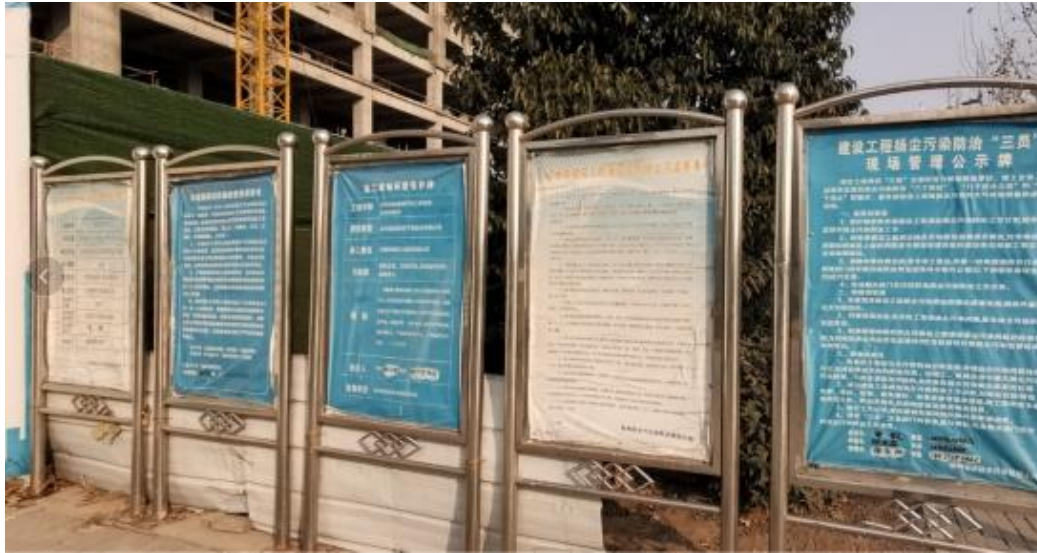
图 8-3 施工现场扬尘、环境噪音及文明施工管理制度公示牌