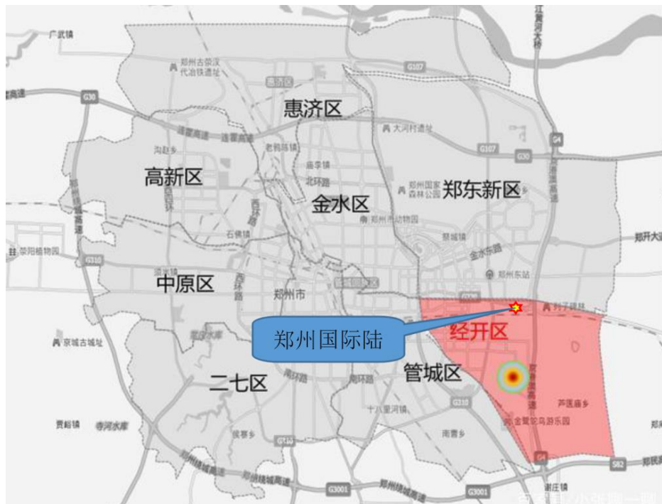
图 1-1 郑州经济技术开发区区位图

郑州国际陆港多式联运物流枢纽体系建设项目，是由河南省政府及郑州市政府建设的内陆无水港和河南对外开放平台，主要由郑州国际陆港公司承建。该公司现有员工 453 人，已建成集国际多式联运、国际贸易、跨境电商、物流科技研发等于一体的枢纽系统，同时也是集汽车口岸、粮食口岸、邮政口岸、保税物流等业务协同发展的综合性大型现代国际物流企业。郑州国际陆港多式联运物流枢纽体系建设项目建设始于 2013 年初，位于郑州经济与技术开发区潮河办事处原营岗村（项目所在位置示意图详见：图 1-1、1-2、1-3）。从图 1-2 中可以看出，项目的周边土地大部分为工业用地，且远离小区，故此项目建设的有限。