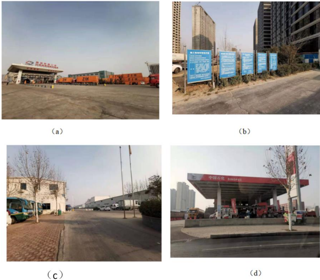
图 8-2 毗邻单位现场图

中铁郑州中心站于 2013 年扩建，总占地面积 1.6 公顷。作为第一类口岸，包括检验楼、海关和检验站、信息平台。作为一个交通枢纽，本项目对其营运影响不大。正商汇航铭筑建筑工地是一个汽车进口项目，目前正在建设中，预计不会受到本项目的影 响。中粮粮油有限公司是中国粮油集团旗下专业从事小麦加工、生产、仓储的大型综合性企业，其紧邻 B 类保税仓库，占地面积约 304 亩，本项目预计影响不大。中石化加油站占地 270 平方米，在汽车进口口岸项目建设过程中受到较小的影响，而且在项目运营过程中加油站还会扩大业务。