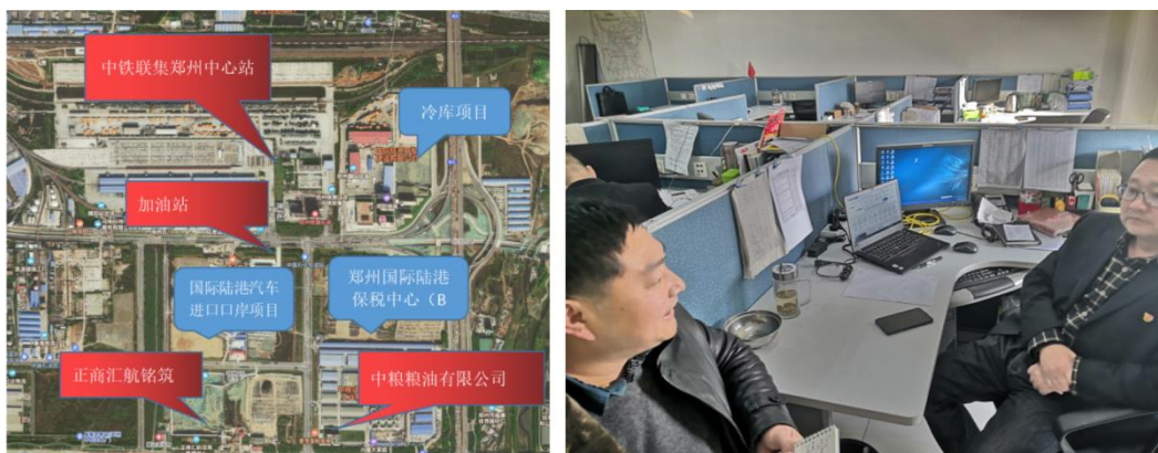
图 8-1 陆港建设项目毗邻单位分布图(左)工作人员现场访谈图(右)

虽然该项目不涉及征地，但三个实体项目建设在三块空地上，因此在项目实施过程中可能会产生潜在影响。为了识别这些影响，于2020年12月20日采用深入访谈的形式对陆港建设项目的周围企业进行了影响情况调研(图8-1)。陆港项目主要毗邻企业有四家分别为：中铁联集郑州中心站(图8-2a)、中石化加油站(图8-2d)、中粮粮油有限公司(图8-2c)、正商汇航铭筑建筑工地(图8-2b)。位置详见图8-1。